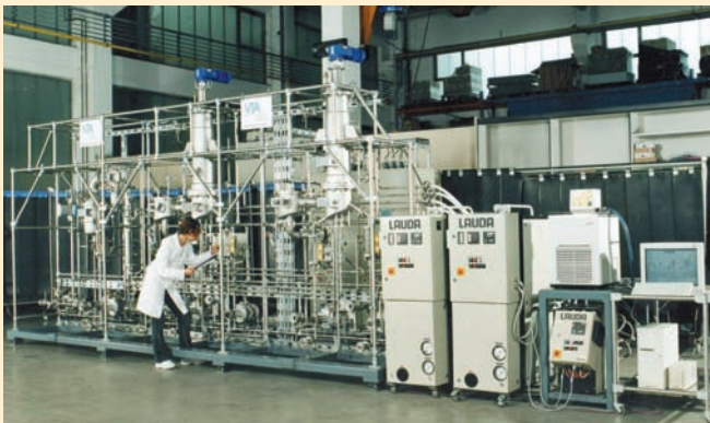
Die zweistufige Pilotanlage besteht aus Kurzwegverdampfern (0,4 m 2 Verdampferfläche) mit mehreren LAUDA Wärmeübertragungsanlagen: Zwei ITH 250/6 KW, ein LTH 303 sowie ein Kältethermostat.

Bei der Entwicklung der Module von Heiz- und Kühlsystemen setzt LAUDA keineswegs auf Serienanfertigung. Jede Anlage wird individuell für die Applikation des Kunden angepasst. Von großem Vorteil ist dabei die firmenerprobte Plug & Play Technik: Da die Heiz- und Kühlsysteme aus montagefertigen Einheiten bestehen, müssen sie vor Ort nur noch „angedockt“ werden. Bereits bei der Planung und dem Entwurf der Anlage für die VTA GmbH wurden Transport, Mobilität und Aufstellung berücksichtigt. Die Fragen der Rohrführung, Isolierung und Sicherheitstechnik wurden im Vorfeld geklärt. Die Anordnung der hydraulischen und elektrischen Anschlüsse können von LAUDA passend für die Gegebenheiten vor Ort realisiert werden. Auch die Baugröße kann angepasst werden.