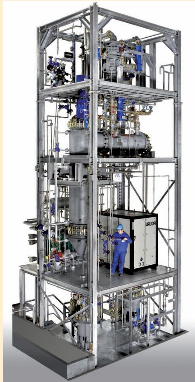
Destillationsanlage in Emaille-Ausführung bestehend aus Dünnschichtverdampfer mit Entgaser für Destillation korrosiver Produkte mit LAUDA Prozesskühlanlage SUK 400 W