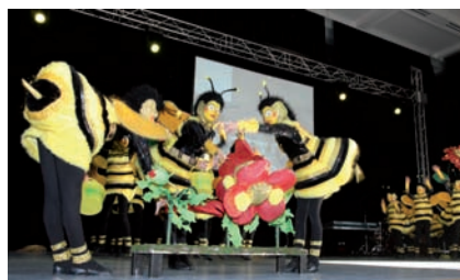
Einen Glanzpunkt des Festes steuerte der Karnevalistische Tanzsportclub (KTSC) mit einem Tanz der „Kleinen Rebengeister“ bei.