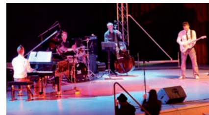
Die Gruppe Dropzone sorgte bis zum Schluss mit jazzigen Tönen für gute Unterhaltung.