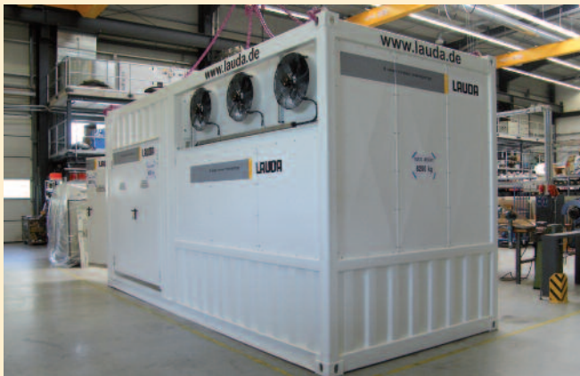
Containeranlage mit Klimatisierung des Maschinenraums für Russland Therminus 2012

In vielen Fällen finden selbst kompakte Temperiergeräte in den vorhandenen Räumlichkeiten keinen Platz mehr. Ein Bau von zusätzlichem Raum für die Produktion ist meist mit erhöhtem Investitionsaufwand sowie mit Anträgen und Genehmigungen von den beteiligten und eingebundenen Behörden verbunden. Nutzt man aber einen Container als separaten Maschinenraum, sind in Deutschland in vielen Fällen nur vereinfachte und in manchen anderen Ländern oft auch gar keine Genehmigungsverfahren erforderlich. Die Container sind mobil und für ein Aufstellen im Freien perfekt geeignet. Die vorhandenen Räumlichkeiten können sinnvoll für andere Zwecke genutzt werden.