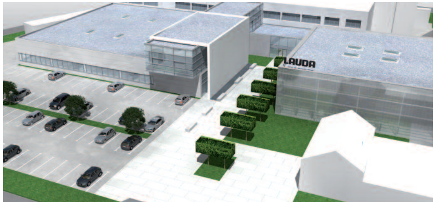
Durch den Rückbau der an der Straße befindlichen ältesten Gebäude, die Wahl von transluzentem Kunststoff für die Lagerhalle und eine Spange als architektonisches Mittel wird das gesamte Firmengelände optisch aufgewertet und LAUDA ein modernes, repräsentatives Gesicht gegeben.

Über Referenzgeräte verschiedener Montagebereiche wurden Wertstromanalysen erstellt. Dadurch konnten wertschöpfende und nicht wertschöpfende Anteile transparent gemacht werden. Überflüssiger Aufwand, wie z. B. unnötiger Transport, Wartezeiten wegen fehlenden Materials, unnötige Wege oder Wartezeiten aufgrund ungeklärter Vorgehensweise sollen reduziert werden. Ansätze hierfür sind die Rationalisierung der Materialversorgung durch Nachschubsysteme wie Kanban, die Trennung von Montage- und Lagertätigkeiten und die Optimierung der Arbeitsplätze und deren Anordnung in der Montagehalle. Dazu gehören auch die Überprüfung der Stücklisten und Arbeitspläne sowie das Hinterfragen der Prozessbeschreibungen und Losgrößen.