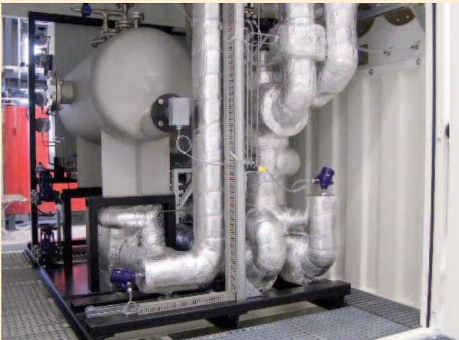
Maschinenraum einer Wärmeübertragungsanlage mit 150 kW Heizleistung und einem Wärmetauscher, der bei Bedarf mit bauseits vorhandener Kühlsole versorgt wird (Temperaturbereich -10 bis 250 °C)

Ein weiteres Plus dieser Containerlösungen ist, dass eine Aufstellung in Ex-klassifizierten Zonen (Zone 1 und Zone 2 nach ATEX 94/9/EG) möglich ist. Dies kann durch eine Überdruckkapselung (Eex-p) erfolgen oder durch den Einbau von ATEX-zertifizierten Komponenten (z. B. Eex-d). Alle Heiz- und Kühlsysteme werden vor der Auslieferung einem ausgiebigen Testlauf unterzogen, bei dem praxisnahe Bedingungen simuliert werden. So wird schon im Werk sichergestellt, dass alle Komponenten funktionstüchtig und einjustiert sind. Vor Ort am Standplatz müssen nur noch die Versorgungsleitungen gelegt werden. Das spart nicht nur Montagekosten, sondern auch Zeit und somit Geld.