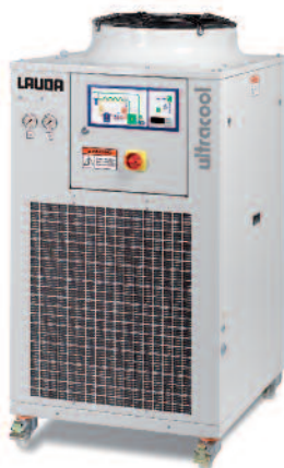
Umlaufkühler UC-0240 SP