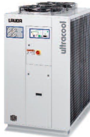
Umlaufkühler UC-0400 SP