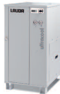
Umlaufkühler UC-0040 SP