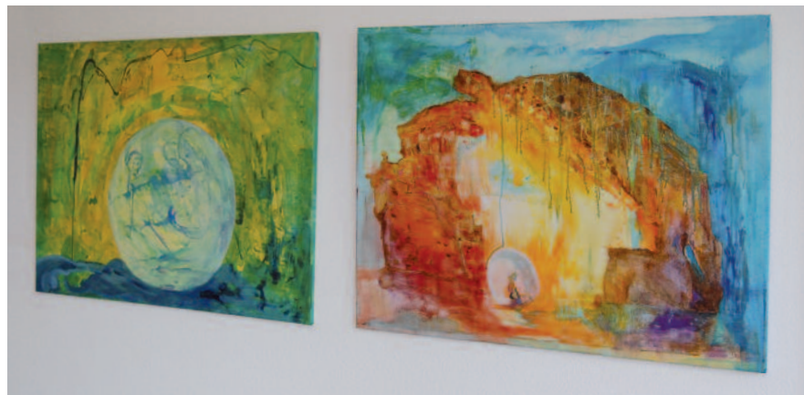
Ines Falcke experimentiert mit Farben.