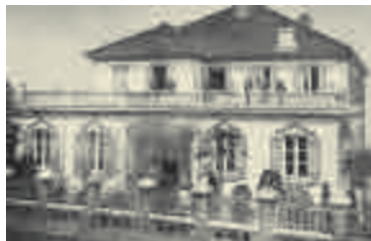
SiberHegner & Co, Yokohama, Japan, 1885